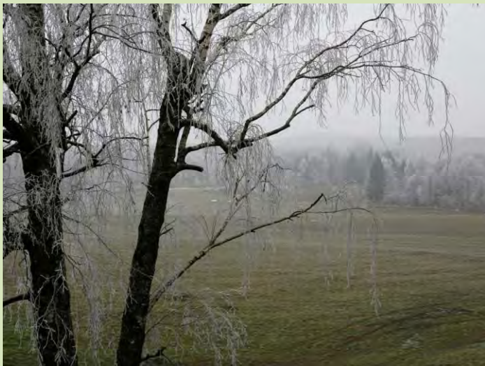
La galaverna sugli alberi della Brughiera: uno spettacolo naturale a rischio a causa del progetto autostradale "Pedemontana alta"

Oltre al danno...la beffa: si preserva il territorio per il suo alto valore ambientale per le future generazioni per poi essere costretti a cederlo per la costruzione di una autostrada, peraltro definita inutile da più parti.