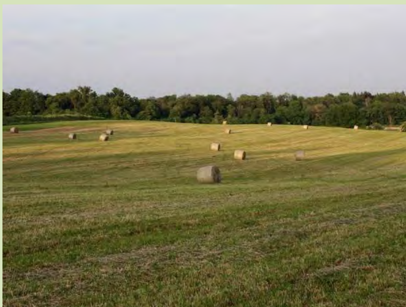
Prati e boschi della Brughiera nella zona del Grillo che verrebbero devastati dall’autostrada “Pedemontana alta”

I motivi principali di questa posizione contraria stanno soprattutto nel fatto che per la parte comasca si prevede di far passare in superficie il tracciato autostradale a 4 corsie, investendo centri abitati e splendide zone di alto valore ambientale, le ultime sopravvissute, quale la brughiera tra Senna Comasco, Capiago/Intimiano, Orsenigo e Albese con Cassano, per poi investire anche il Parco della valle del Lambro.