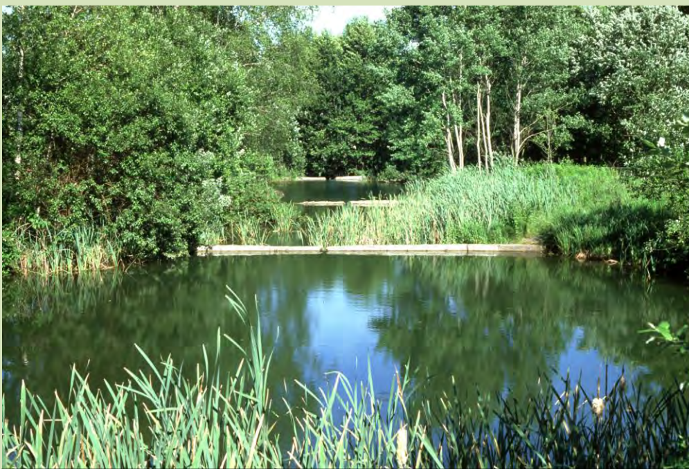
Le vasche di Inchigollo, in prossimità del tracciato della devastante "Pedemontana alta"

Come già detto, scelte scellerate e calate dall'alto; ma anche decisioni mai assunte in decenni, da parte di Como, che sarebbero servite a moderare sia le espansioni edificatorie sia ad individuare passaggi più agevoli per assi viari nuovi o potenziati meglio adatti a deviare il traffico di transito fuori città. Così ora ci si trova a dover dare una risposta "tecnica" al problema degli abitanti che vivono nella zona investita dall'arrivo della tangenziale. Sicuramente, a nostro parere, la soluzione a tale problema non è un'autostrada a pagamento, a 4 corsie, come la VA-CO-LC, ma nemmeno soluzioni emergenziali che vanno "in deroga" al buon senso urbanistico e ambientale. A nostro avviso solo i Comuni, con l'aiuto della Provincia di Como, possono trovare la chiave per risolvere questa gravissima situazione. Certo è però che i finanziamenti per qualsiasi proposta non possono che arrivare dalla Provincia, dalla Regione o dal Ministero dei trasporti: il peso economico di questo problema non può essere solo locale, ma le scelte per la sua soluzione è fondamentale che lo siano.