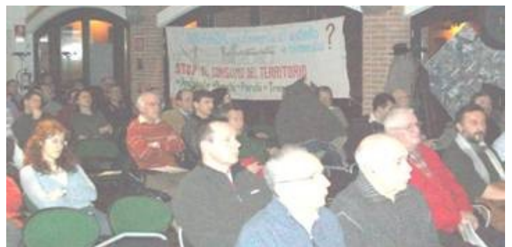
Il pubblico numeroso e attento