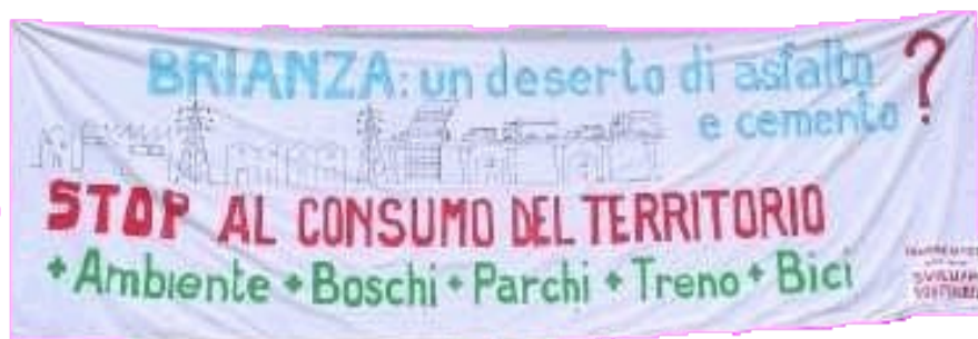
Lo striscione della serata

Per tale motivo, la Rete, come primo passo operativo, inoltrerà ai Comuni della tratta B2, una richiesta d'incontro per meglio chiarire le loro posizioni e per discutere sull'assegnazioni di fondi supplementari per le Compensazioni Ambientali.