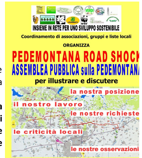
Il manifesto dell'iniziativa