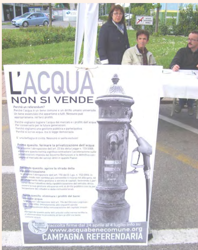
Non svendiamo L'ACQUA al PROFITTO !