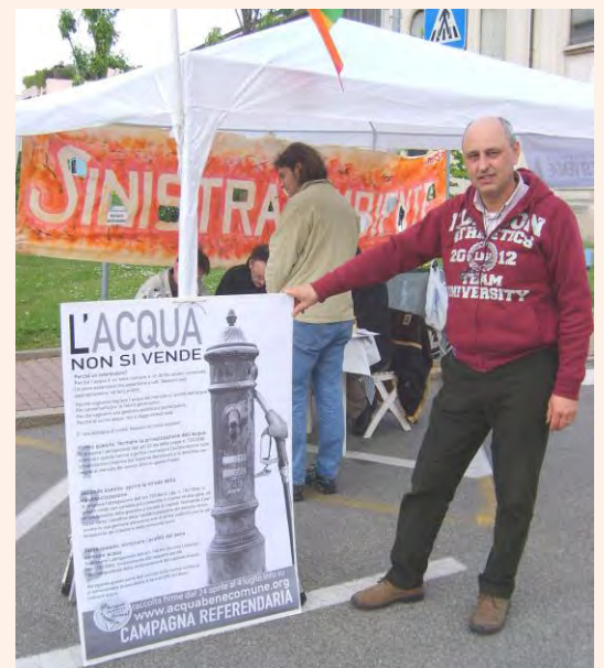
Tiziano illustra i contenuti dei tre quesiti referendari