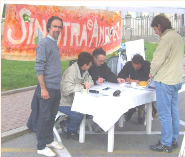
Ci si confronta .....