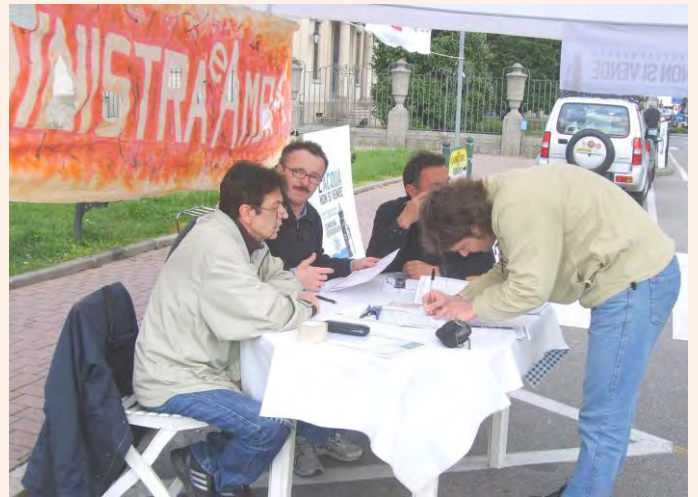
..... e si firma !