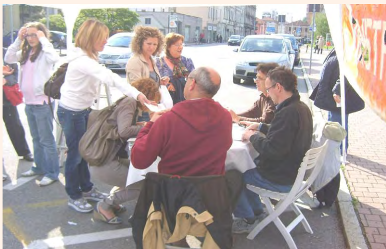
Affollamento al banchetto