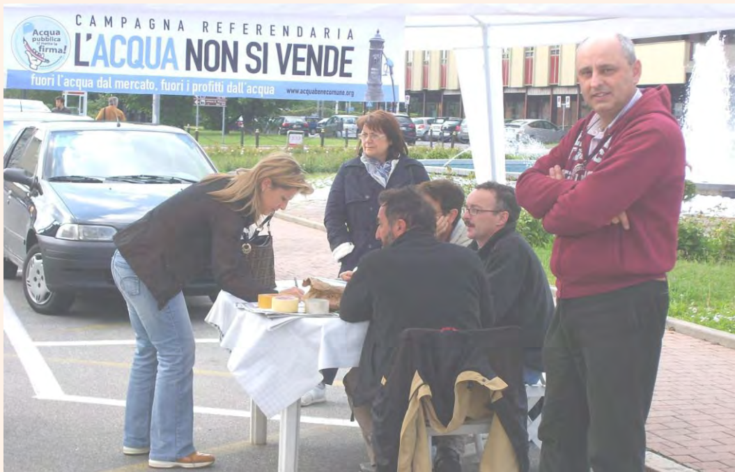
Primi arrivi al banchetto