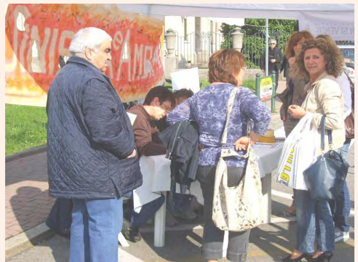
In attesa per aderire alla richiesta di REFERENDUM per l'ACQUA PUBBLICA