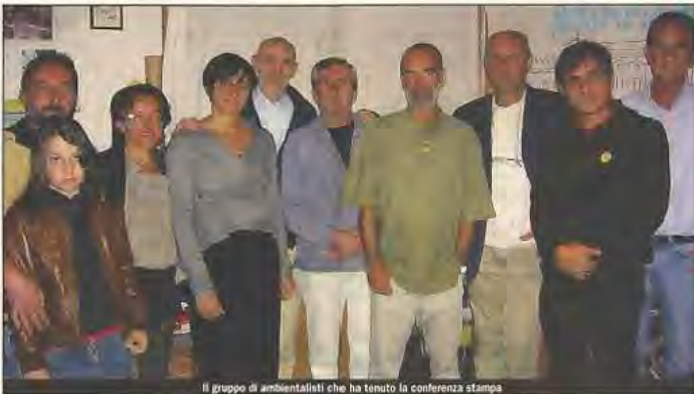
Il gruppo di ambientalisti che ha tenuto la conferenza stampa